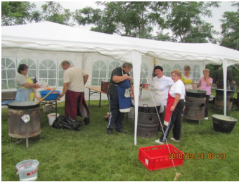
Készült a finom ebéd.