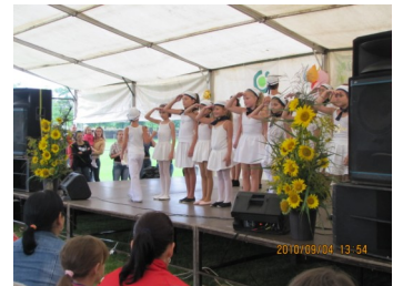
Bodonhelyi showtáncosok műsora.