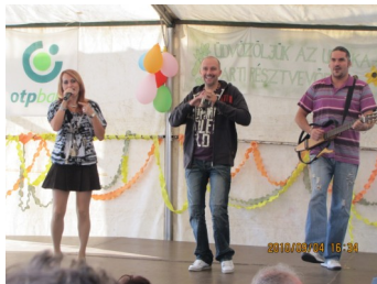
Sztárvendég a DESPERADO együttes volt.