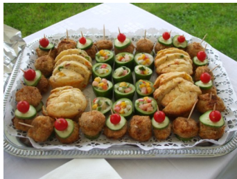
Együtt Markotabödögéért Egyesület finomságai.