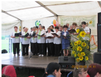
A markotabödögei „Őszirozsza” Nyugdíjasklub.