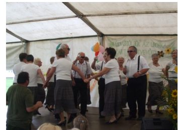
Nemesszalóki „Őszidő” együttes.